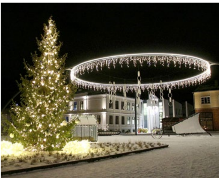
Elus jõulupuu Võru keskvaljakul täna...

Tere, mina olen Võru linna jõulupuu. Kuni eelmise aasta sügiseni elasin puukoolis, kus mind koolitati ja kasvatati. Nüüd täidan igapäevaselt auväärset rolli – olen Võru linna vapi sümbol. Jõuludeks on mulle antud eriulesanne – olla jõulupuu Võru linna keskvaljakul. Esimeseks advendiks sain endale valge sädeleva jõulurüü ja leidsin kohe palju uusi sõpru. Olen küll väike, aga silmapaistev. Mind teeb eriliseks see, et saan koos lastega kasvada lastesõbralikus linnas ja pakkuda rõõmu nii suuretele kui ka väikestele võrulastele. Tule mind vaatama!