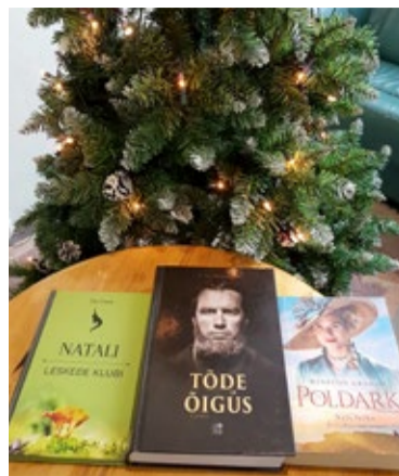
Tänavu Võrus enim laenutatud raamatud.