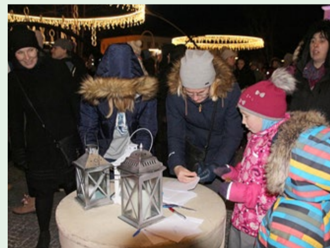
Vilgas tegevus heade soovide postkasti juures.