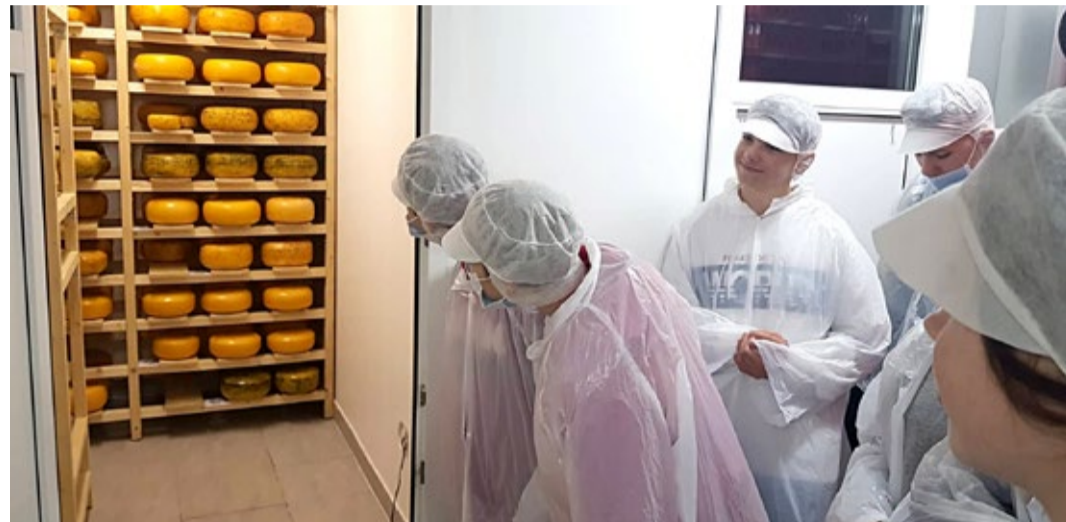
...ning uudistamas Vastseliinas asuvat juustutööstust.