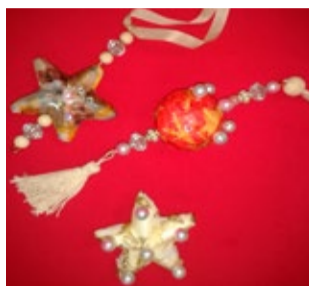
Laste ja vanemate töötoas valminud jõuluehted.

Kui laps ei oska oma nutu põhjustest rääkida, tuleks täiskasvanul endal probleemi allikas leida ja kõrvaldada.