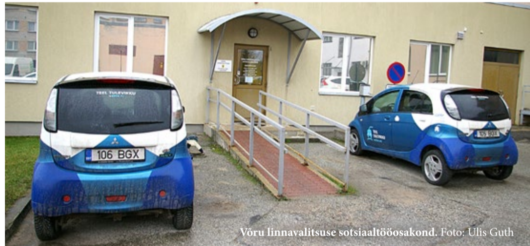
Võru linnavalitsuse sotsiaaltöösakond.

Eve Ilisson, sotsiaaltöösakonna juhataja