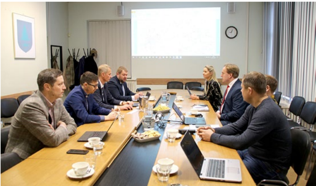
Hetk keskkonnaministri ja tema kaaskonna kohtumisest Võru linnavalitsuse esindajatega.