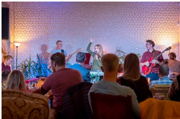
Souli oõtsumist, funki astumist, bluusi laengut ja jazzi krutskeid pakkunud Alfa Collective'i esinemine Stedingu kohvikus.

Kagu-Eesti kontserdikülastajate seas tuntuks saanud Võru Jazzklubi on parajasti lõpetamas oma viiendat hooaega. 15. novembril leidis aset nende järjekorras viiekümnes kontsert.