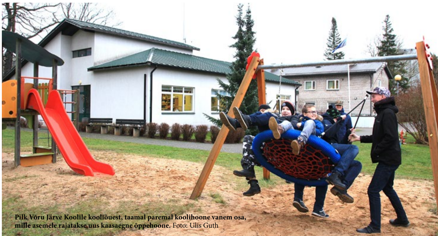
Pilk Võru Järve Koolile kooliõuest, taamal paremal koolihoone vanem osa, mille asemele rajatakse uus kaasajastatud õppehoone.