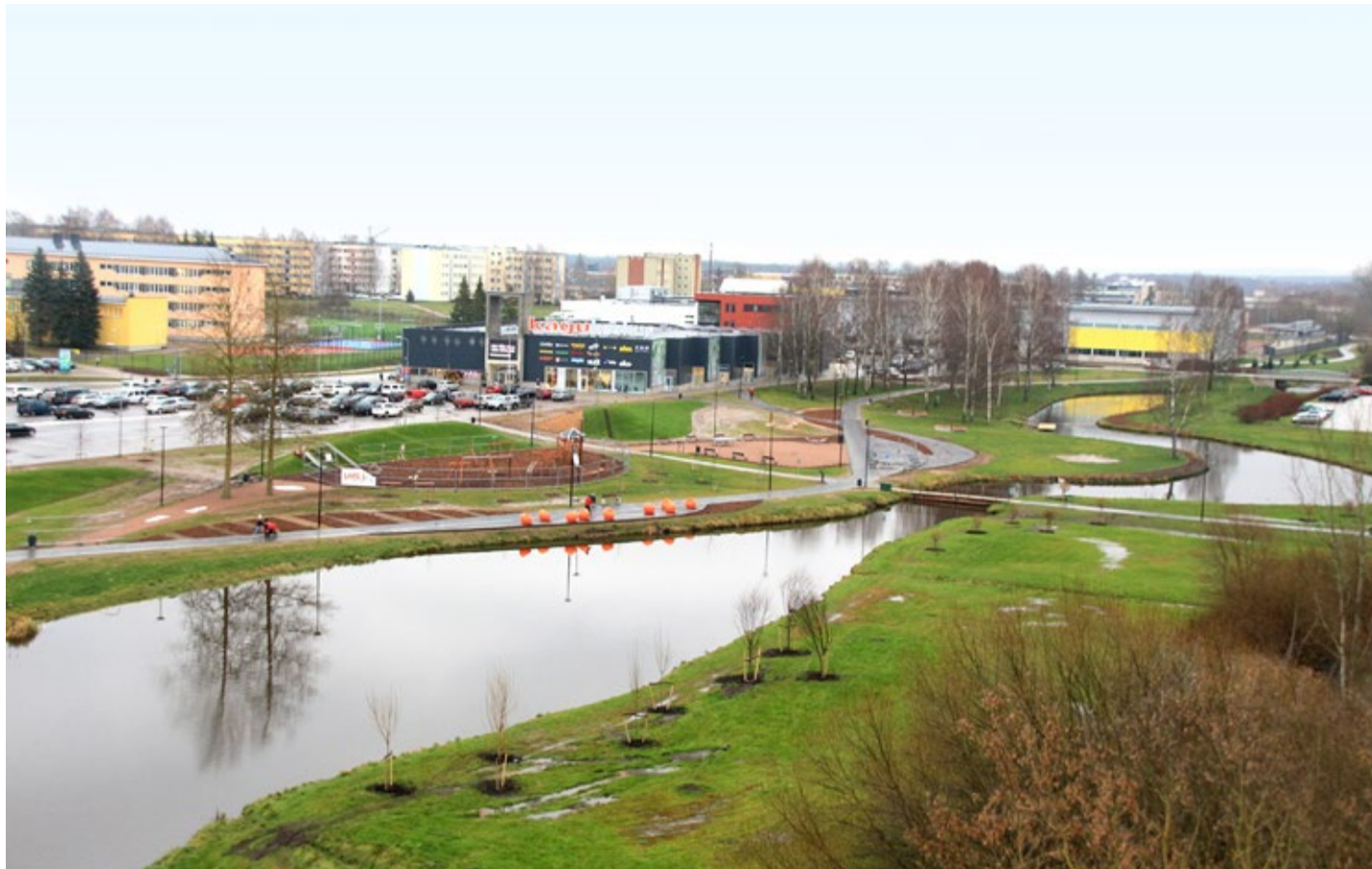
Värskest valminud Koreli oja rohekoridor ja rekreatsiooniala.

Läinud kuul jõudsid lõpule juulis alustatud ehitustööd Koreli oja ja piirneval Petseri ja Vabaduse tänava vahelisel alal, mille tulemusena valmis seal nägus ja multifunktsionaalne rekreatsiooniala.