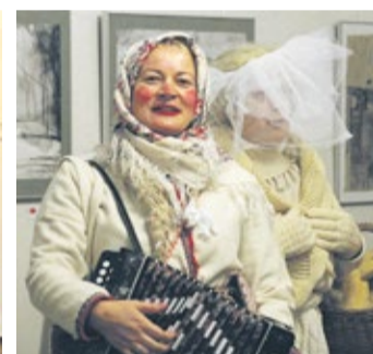
▲ Kultuuritöötajatest kadrid külakosti toomas.