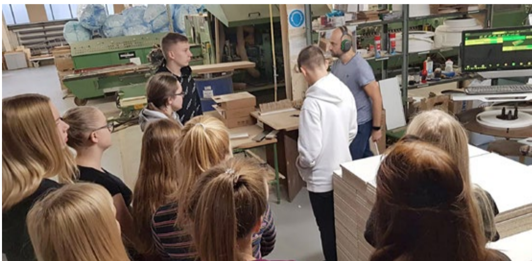
Võru Kesklinna Kooli lapsed tutvumas mööblitööstusega...

Karjäärivalik on inimese elus üks suuremaid otsuseid ning parim viis omandada ettekujutus töömaailmast on keset ettevõtete igapäevategevusi. Kui me tahame edendada ettevõtlust ja ettevõtlikkust üle Eesti, siis on oluline näidata noortele, et töövõimalused ei asu vaid suurtes tömbekeskustes, vaid ka kodukandis leidub atraktiivseid võimalusi eneseteostuseks. Meie varasem kogemus näitab, et pea 70% õpilastest on huvitatud külastatud ettevõtetesse kas praktikale või tööle minema.