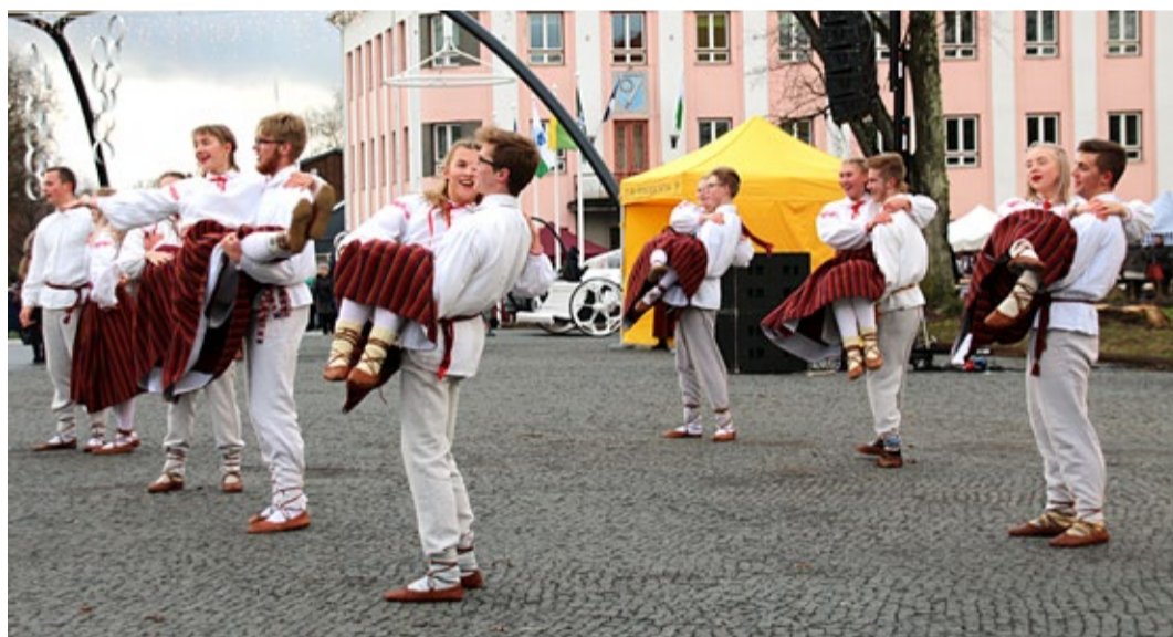
Esineb noortesegarühm Hopser.