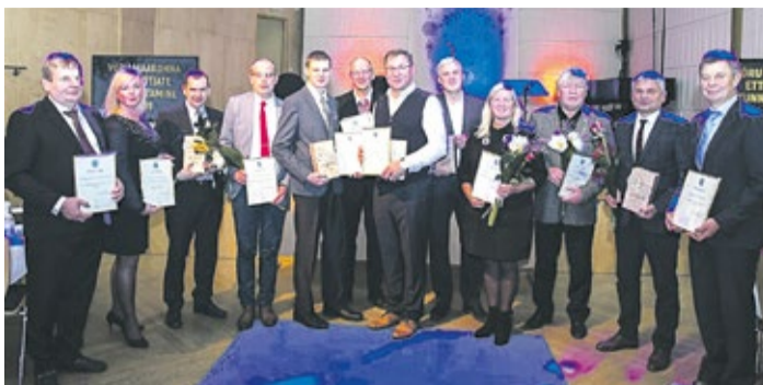
Nominendid ja laureaadid ühisel pildil.

arv – 23-lt 34-ni. 2018. aastal kasvas müügitulu aga enam kui 30%. Ettevõtte on Eesti Töötukassa hea koostööpartner. Suur hulk tänastest töötajatest on ameti selgeks õppinud läbi töötukassa tööpraktika.