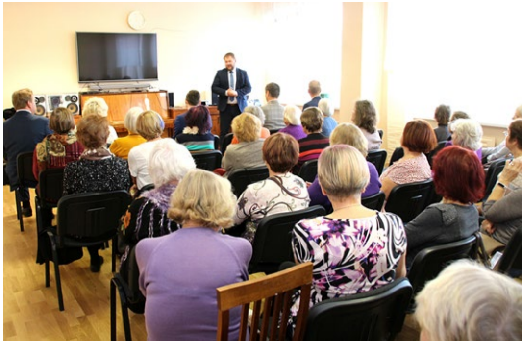
Keskonnaminister Rene Kokk Võru Pensionäride Päevakeskuses tähelepaneliku kuulajaskonna ees.

3. detsembril korraldas keskkonnaministeerium Võrus esimese eakate jäätmekooli, kus selgitati üksikasjalikult jäätmete liigiti kogumise põhitõdesid. Samasuguseid jäätmekoolitusi korraldatakse edaspidi ka teistes Eesti linnades.