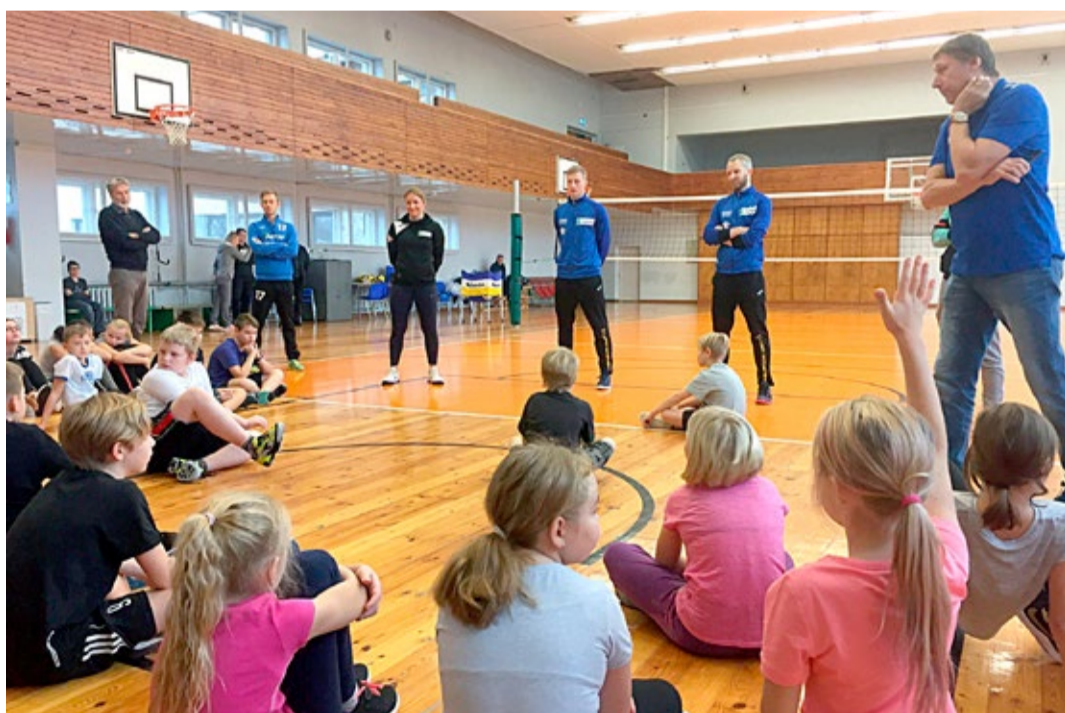
✓ Väarikas võrkpallidelegatsioon Võru Kesklinna Kooli laste ees.