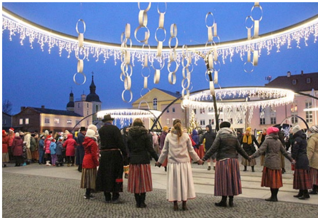
Tore tantsupäev lõppes ühistantsimisega õhtupimeduses.