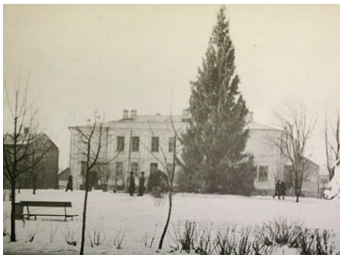
... ja näärikuusk enam-vähem samas kohas 1965. aasta 1. jaanuaril.