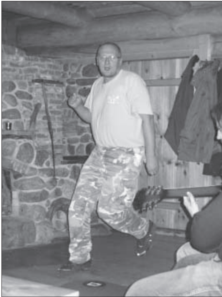
Contra esinemist ilmestas lisaks muusikale ka tants