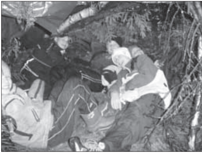
Ellujääjad enda ehitatud onnis.

Päev algas teoreetilise osa ja õppefilmi vaatamisega. Õpilased said teada, mida peab sisaldama isiklik ellujäämis-komplekt. Õpetati tule tege-mist erinevates olukordades. Räägiti vee tähtsusest ja selle kasutamisest looduses. Saadi vajalikud teadmised käepäras-test materjalidest varjualuse ehitamiseks ning looduslikes tingimustes toidu hankimiseks. Arutati läbi ka kriisiolukord, kuidas käituda ja ellu jääda