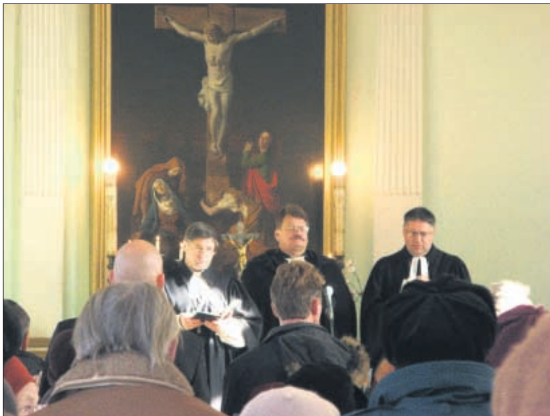
21. oktoobri hommikul peeti EELK Võru Katariina kirikus võrulaste tahteväljenduspäeva jumalateenistus.