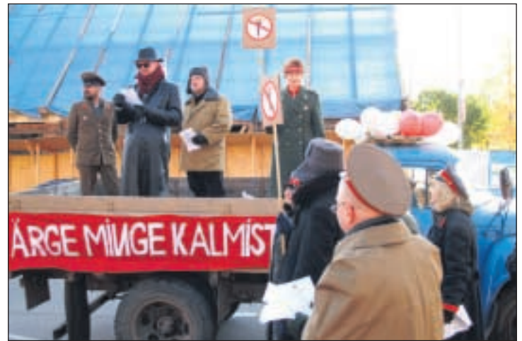
1987. aasta 21. oktoobri mälestusmiitingu kutsus kokku rühm noori, kes nimetasid end eriuksuseks "Keissi", millest kasvas hiljem välja Vaba-Sõltumatu Kolonn Nr 1. Noored korrasid Vabadussõjas langenute kalmud, paljundasid kutset mälestusmiitingule kirjutusmasinal ning levitasid seda tuttavate hulgas. Ilmselt poleks kuigi paljud inimesed miitingust kuulnudki, kui võimuorganid poleks sekkunud jõulise vastupropagandaga – tänu sellele levis info kogu linnas kiiresti. 21. oktoobril oli Võru linn täis kõikvõimalikke mundrimehi lähedalt ja kaugel... Pildil kostümeeritud Vaba-Sõltumatu Kolonn Nr 1 liikmed, kes tuletasid linlastele meelde 20 aastat tagasi aset leidnud sündmusi.