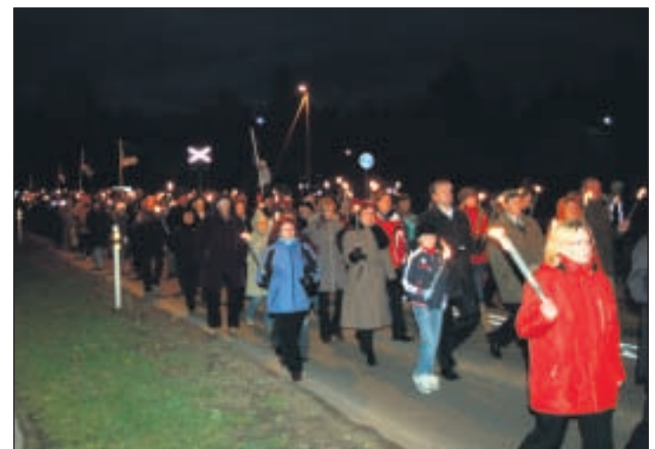
Tõrvikurongkäigust, millega liitus järjest enam inimesi, võttis osa üle 500 võrulase.