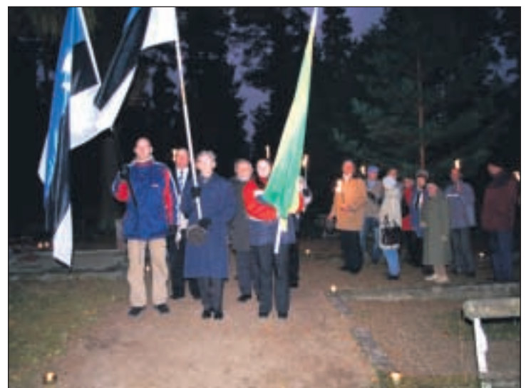
Võru kalmistul Vabadussõja monumendi juures mälestati jumalateenistusega Vabadussõjas langenuid ning Vaba-Sõltumatu Kolonn Nr 1 igavikku lahkunud liikmeid. Pärast jumalateenistust kogunesid inimesed tõrvikurongkäiku, mis suundus kalmistult kesklinna – samal marsruudil nagu 20 aastat tagasi.