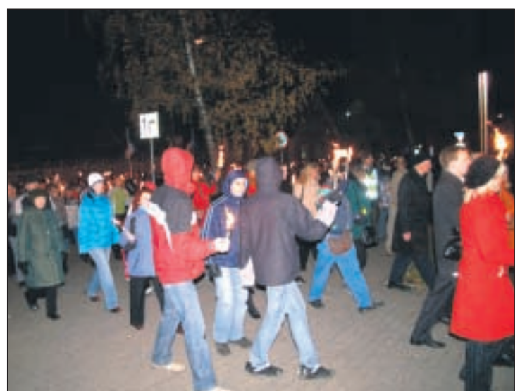
Tahteväljenduspäeva kogunes Kesklinna parki tähistama ligi 2000 inimest.