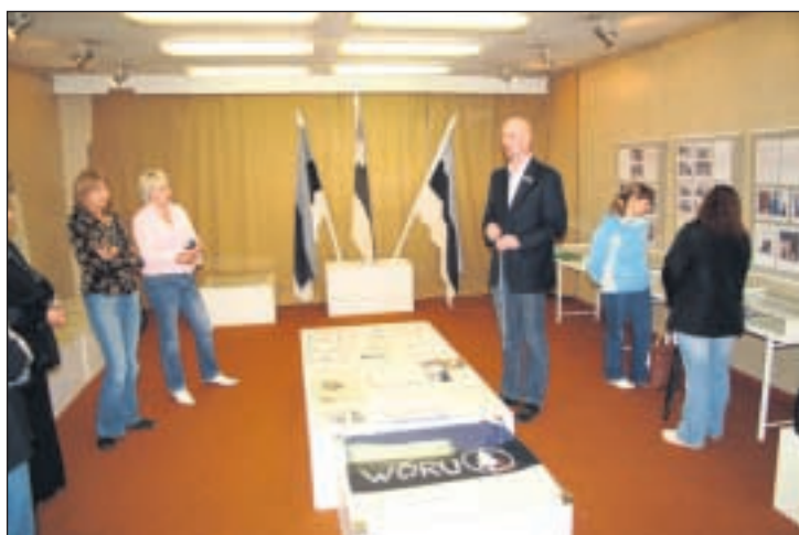
Ain Saar Võrumaa muuseumis Vaba-Sõltumatu Kolonni Nr 1 trüki- ja fotomaterjalidest ning vähestest säilinud eksponaatidest koostatud näituse avamisel. Näituse seadsid üles Maimu Telk ja Artur Ruusmaa.