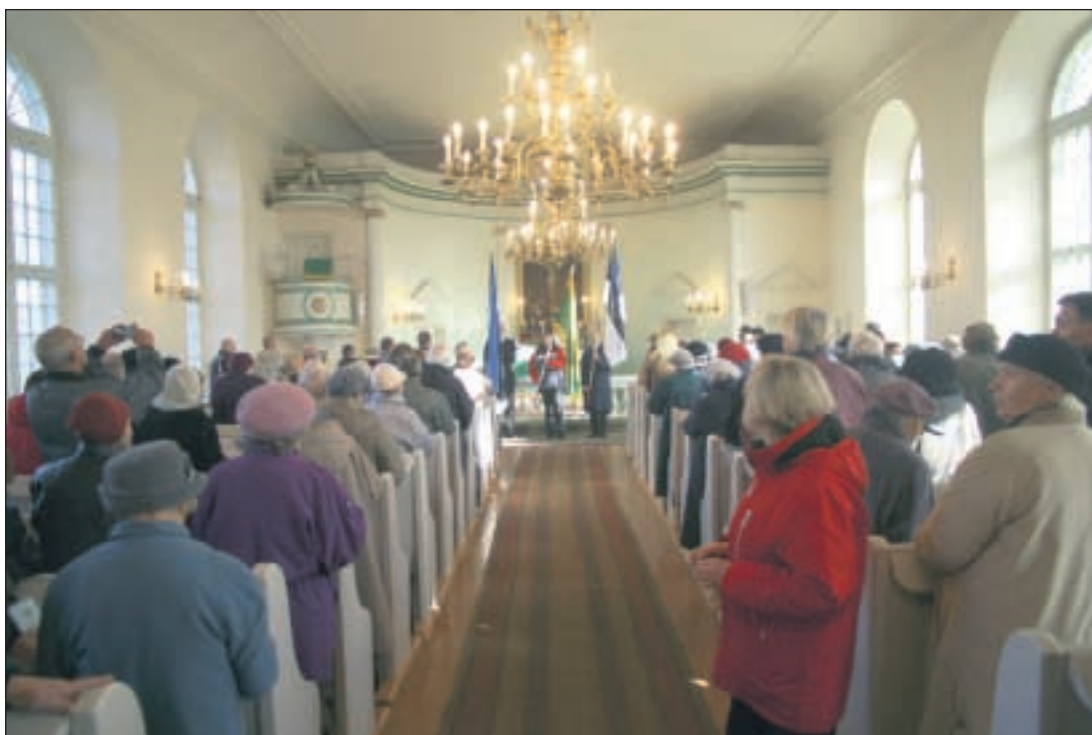
Jumalateenistus Katariina kirikus.