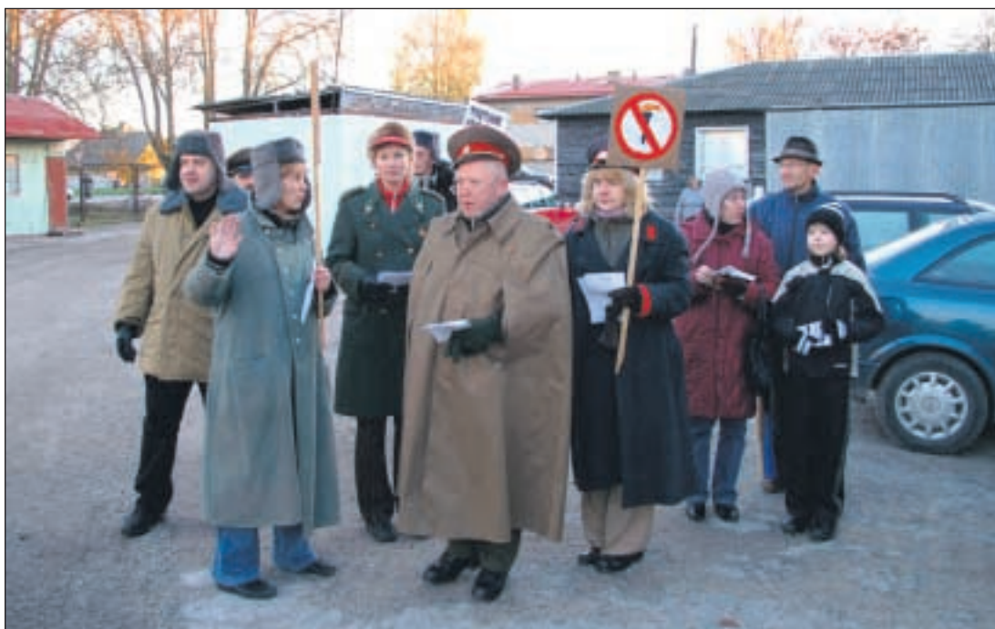
Et piitlikult meelde tuletada tollaste võimude aktsioonivastast kampaaniat ja jõudemonstratsiooni, mille vastu võrulased julgelt astusid, korraldas Vaba-Sõltumatu Kolonn Nr 1 tahteväljenduspäeva eel Võrus „EKP Võru Rajoonikomitee sügistuuri“ – punaarmeelesteks, julgeolekutöötajateks ja miilitsionäärideks kostümeeritud salk liikus Võrus ringi ja keelas inimesi mitte ühinema ekstremistide tõrvikurongkäiguga.

◀ 20 aasta eest saavutas propaganda vastupidise tulemuse – mälestusmiitingule kalmistul tuli mitu tuhat võrulast.