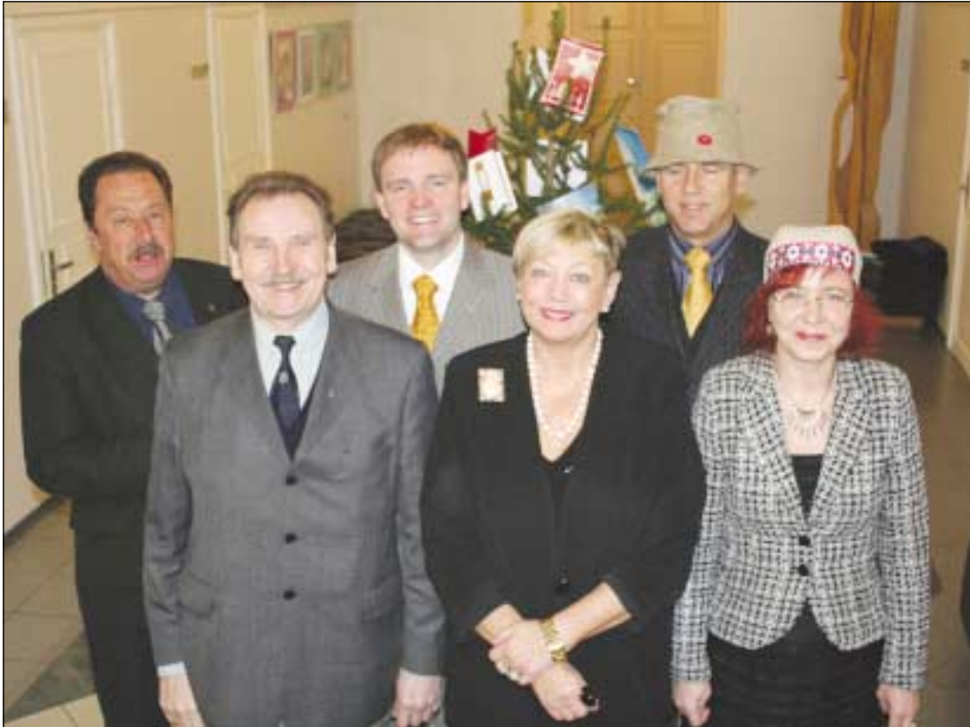
Võru Linnavalitsus ja -volikogu soovivad Võru linna elanikele rahulikku jõule ja rõõmsat vana aasta lõpu.