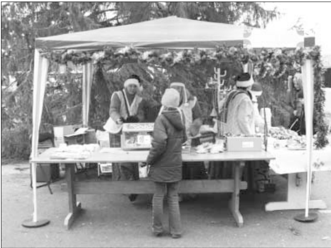
„Päkapiku lasteaed“ – Jõululoterii leti taga tegutsesid päkapikud „Päkapiku“ lasteaiast.