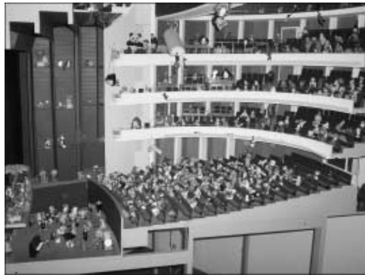
Soome Rahvusoperi saalist läbilõikeline makett